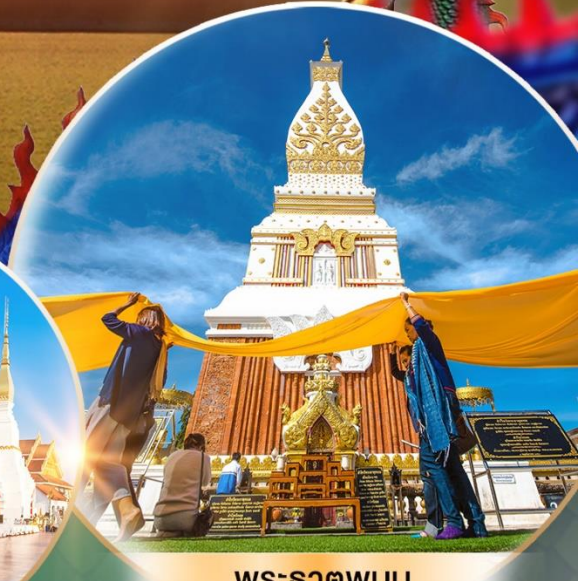
พระธาตุพนม