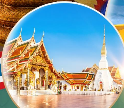
พระธาตุเชิงชุม